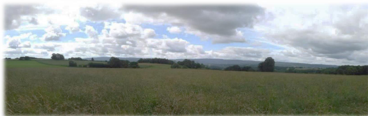
Photographie panoramique de l'aire d'étude, NCA Environnement, Juin 2018