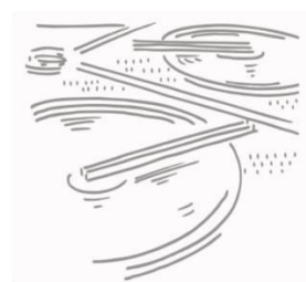
Hydraulique urbaine Eau et Assainissement