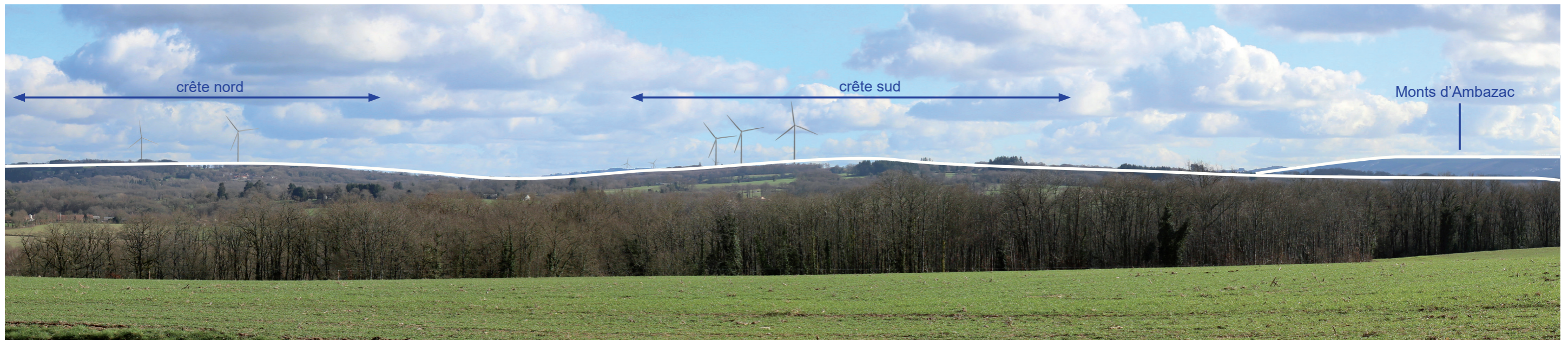
Photographie 163 : Photomontage depuis la D220 au nord-ouest de la ZIP, à 4,9 km (PM 21)

Les éoliennes soulignent les deux lignes de faîte et sont par conséquent en cohérence avec le socle physique.